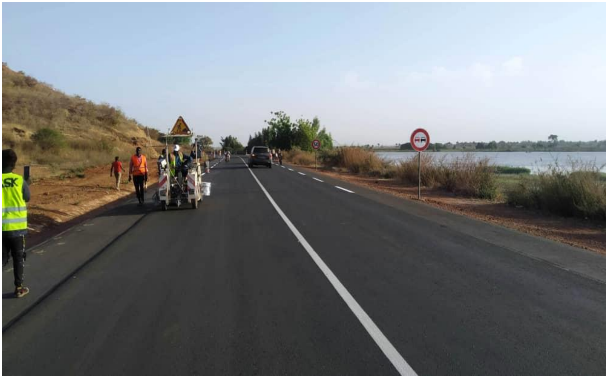
Travaux de signalisation sur Bella II-Gaya