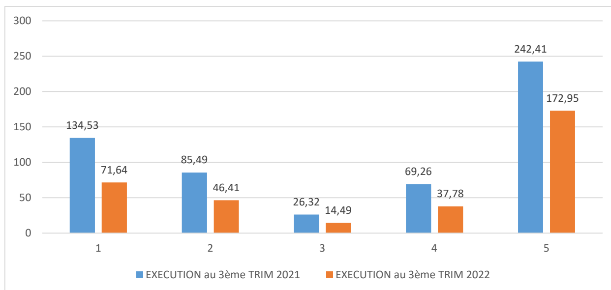
Graphique 2 : Comparaison de l'exécution du budget de l'Etat 2021 et 2022 au 3 èmes trimestres

Le tableau ci-après donne l'exécution des dépenses par catégorie budgétaire en milliards de F CFA.